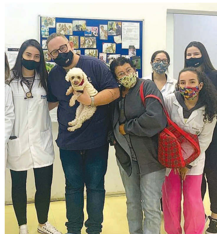
Paciente no dia da alta com o tutor de equipe

Desde 2003, o Hospital Veterinário Escola da FESB atua na região, proporcionando um ambiente de aprendizado aos nossos graduandos, bem como atendimento de qualidade a diversas espécies animais.