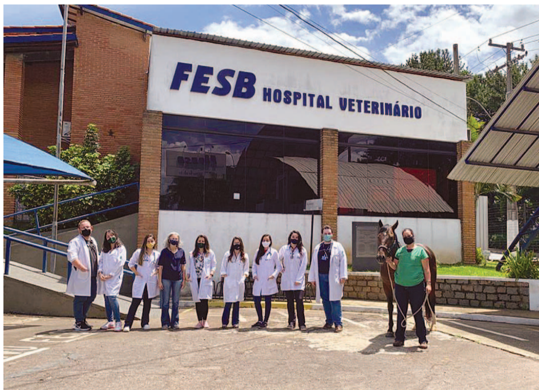
Parte do corpo clínico do Hospital Veterinário Escola da FESB

A inserção dos cães e gatos no núcleo familiar está cada vez mais frequente. Com isso, se intensificaram os cuida-